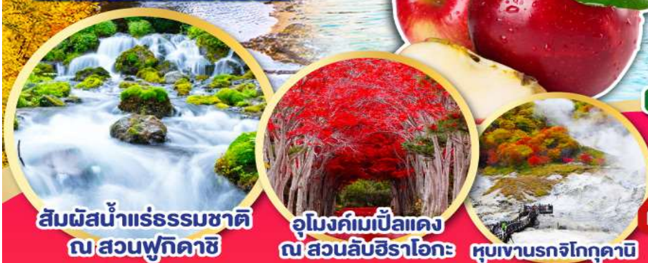
สัมผัสน้ำแร่ธรรมชาติ ณ สวนพุทิตาชิ