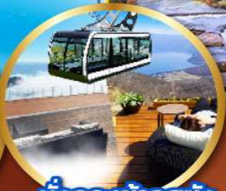
นิงกระเข้าอุซซัง

พิเศษ!! บุฟเฟ่ต์ร้าน NANDA ดีที่สุดในชิบโปโร