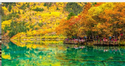
อุทยานแห่งชาติจี๋จ้ายโกว