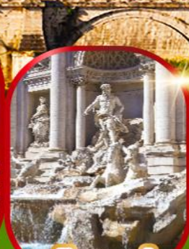
น้ำพุเทรวี่

เดินทาง 15-22 พ.ย.67 28 พ.ย. - 5 ธ.ค.67 26 ธ.ค.67 - 2 ม.ค.68(ปีใหม่) 28 ธ.ค.67 - 4 ม.ค.68(ปีใหม่)