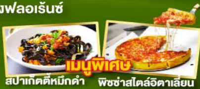
เมนูพิเศษ สปาเกตตีหมีดำ พิชซ่าสไตล์อิตาลี