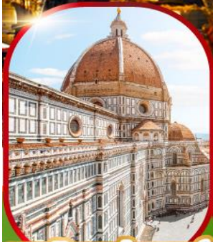
มหาวิหารฟลอเรนซ์