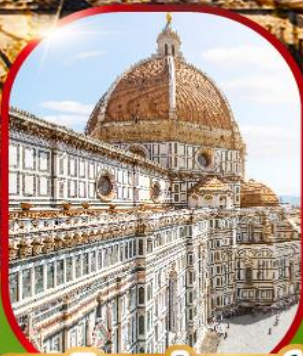
มหาวิหารฟลอเรนซ์