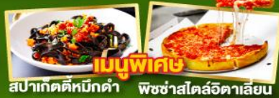
เมนูพิเศษ สปาเก็ตตีหมึกดำ พิชซ่าโดลิอิตาเลียน