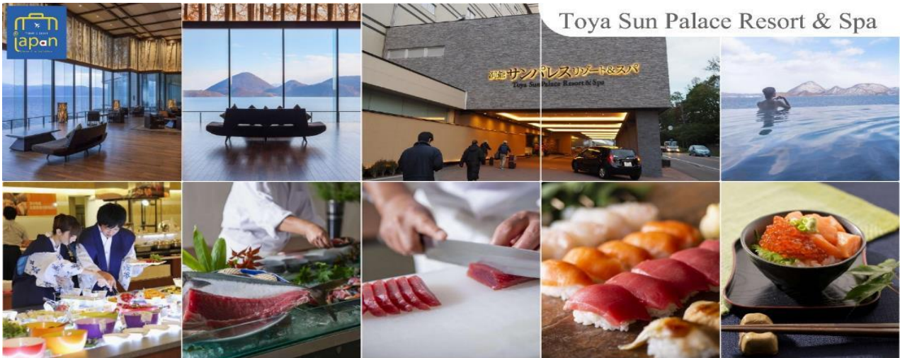
Toya Sun Palace Resort &amp; Spa

TOYA SUN PALACE RESORT & SPA หรือเทียบเท่าระดับเดียวกัน