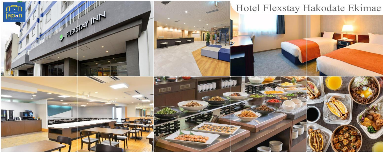
Hotel Flexstay Hakodate Ekimae

เย็นที่พัก รับประทานอาหารเย็นอิสระตามอัธยาศัย FLEX STAY INN HAKODATE EKIMAE หรือเทียบเท่าระดับเดียวกัน