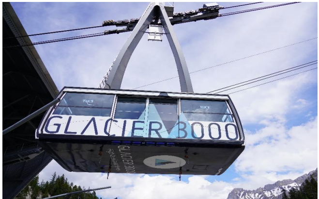
Highlight! กระเช้าไฟฟ้าขนาดยักษ์ที่จุผู้โดยสารได้ถึง 125 คน

นำท่านเดินทางสู่ หมู่บ้านโคล เดอ ปียง (Col De Pillon) เป็นที่ตั้งของสถานี นำท่านนั่งกระเช้าลอยฟ้า สู่ ยอดเขากลาเซียร์ 3000 (Glacier 3000) มีความสูงเกือบ 3,000 เมตรเหนือระดับน้ำทะเล ชมทิวทัศน์อันงดงามของท้องฟ้าและเทือกเขามากมายแบบพาโนรามา และให้ท่านท้าทายความสูงเดินบน "The Peak Walk by Tissot" สะพานแขวนที่มีความยาว 107 เมตรข้ามหน้าผาที่ระดับความสูง 3,000 เมตร ทำให้เป็นสะพานแขวนที่สูงที่สุดในโลก