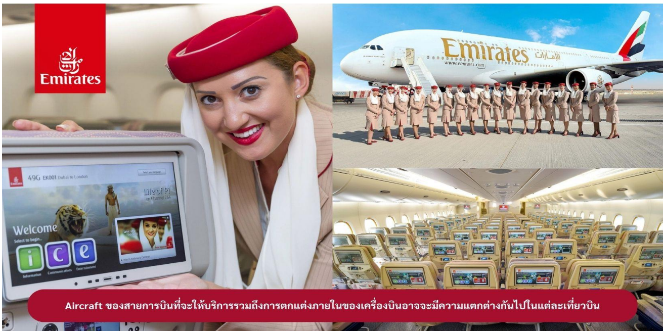
Aircraft ของสายการบินที่จะให้บริการรวมถึงการตกแต่งภายในของเครื่องบินอาจจะมีความแตกต่างกันไปในแต่ละเที่ยวบิน