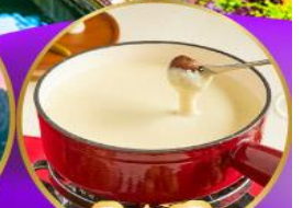
ฟองดูชีส