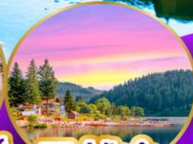
ทิกเกิเซ่ ปาดำ