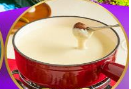
ฟองดูชีส