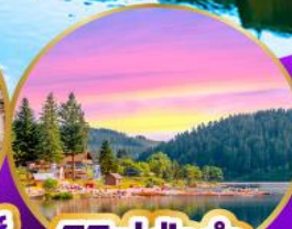
ทิกิเซ่ ปาดำ