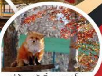
หมู่บ้านสุนัขจิ้งจอกซาโอะ