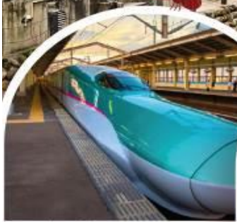
ขั้รถไฟชินคันเซ็น