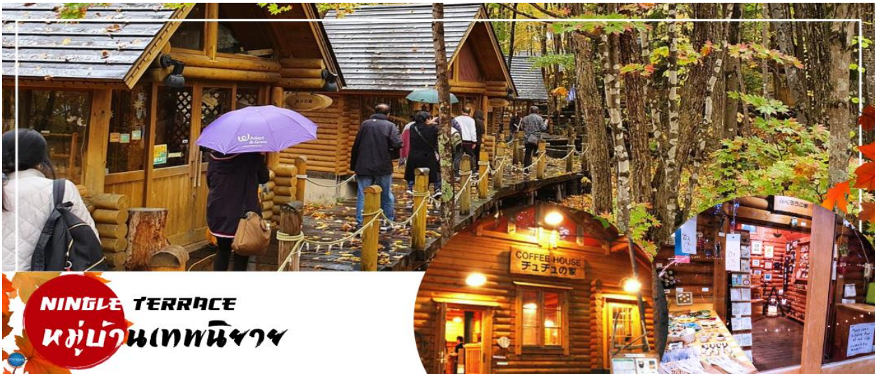
NINGLE TERRACE หมู่บ้านเทพนิยาย

เดินทางสู่ หมู่บ้านเทพนิยาย นิงเกิ้ลเทอเรส (NINGLE TERRACE) เป็นหมู่บ้านงานฝีมือและทางเดินไม้ในป่าที่เหมือนกับศิลปะในเทพนิยาย ซึ่งประกอบด้วยร้านค้า 15 ร้าน (บ้าน 15 หลัง) ที่จำหน่ายสินค้าแบบออริจินัลของท้องถิ่น โดยมีร้านกาแฟ Chu Chu no Ie ตั้งอยู่ใจกลางของหมู่บ้าน ร้านค้าต่างๆ จะอยู่ไม่ไกลกันมาก ทำให้ดูเหมือนเป็นหมู่บ้านซึ่งอยู่ท่ามกลางป่า คล้ายบ้านในเทพนิยาย หน้าหนาวเช่นนี้ก็จะได้บรรยากาศหิมะแบบชาวโพลน แต่ในฤดูร้อนก็จะได้บรรยากาศของป่าสนเขียวชอุ่มกับบ้านไม้ในป่าสน อิสระตามอัธยาศัย