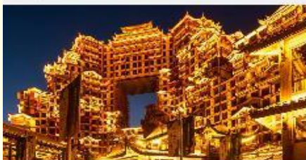
ดึกมหัศจรรย์ 72 ชั้น