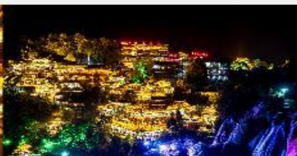
ฟูหรงเจิน