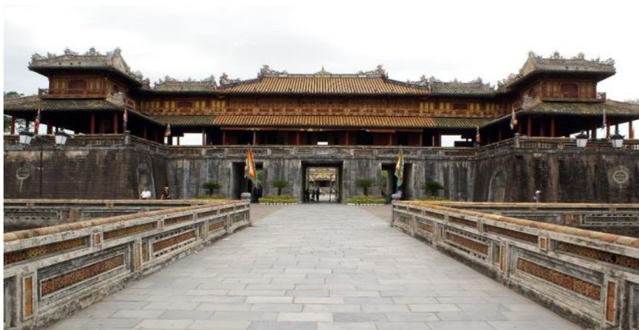
หน้า 3 (ภาพใช้เพื่อการโฆษณาเท่านั้น)

นำท่าน นำท่านชม พระราชวังโบราณ (ชมด้านนอก) หรือพระราชวังหลวงแห่งนครประวัติศาสตร์ สัมผัสความยิ่งใหญ่และโอ่อ่าของประตูเมืองแห่งพระราชวังหลวง พระราชวังแห่งนี้ได้รับอิทธิพลมาจากพระราชวังต้องห้ามปักกิ่ง ประเทศจีน พระราชวังแห่งนี้เคยเป็นที่ประทับของราชวงศ์ลำดับสุดท้ายของประเทศเวียดนาม