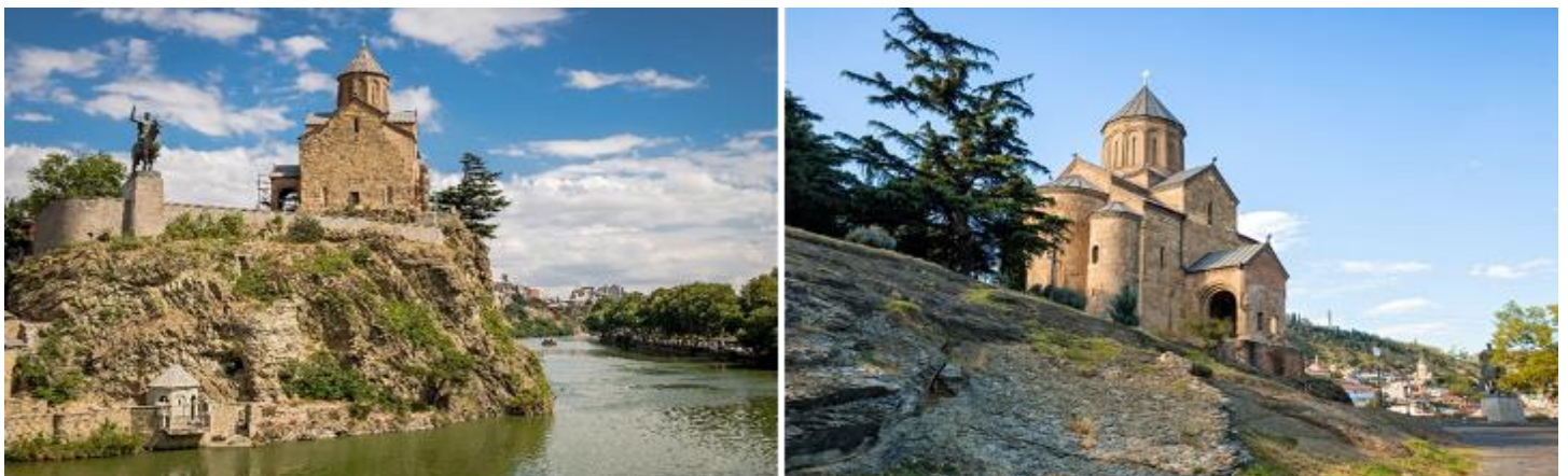
หน้าที่ 5 . ***ภาพประกอบใช้เพื่อการโฆษณาเท่านั้น***

นำท่านไปชม โบสถ์เมเทห์คี (METEKHI CHURCH) โบสถ์ที่มีประวัติศาสตร์อยู่คู่บ้านคู่เมืองของทบิลีซี ตั้งอยู่บริเวณริมหน้าผาของแม่น้ำทวารี เป็นโบสถ์หนึ่งสร้างอยู่ในบริเวณที่มีประชากรอาศัยอยู่ ซึ่งเป็นประเพณีโบราณที่มีมาแต่ก่อน กษัตริย์วาคตัง ที่ 1 แห่งจอร์กาซาลี ได้สร้างป้อมและโบสถ์ไว้ที่บริเวณนี้