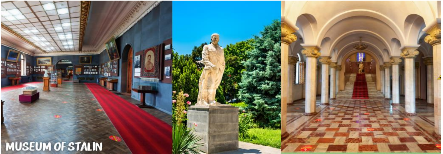
MUSEUM OF STALIN

นำท่านออกเดินทางสู่เมือง KUTAISI เป็นเมืองเล็กๆที่อยู่ระหว่างเมืองท่องเที่ยว UPLOSTSIKHE หรือ GORI และเมือง MESTIA (ใช้เวลาเดินทางประมาณ 2.30 ชม.)