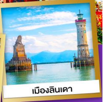
เมืองลินเดา