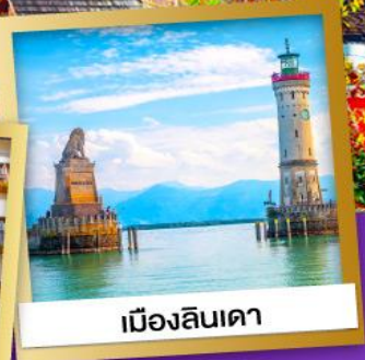
เมืองลินเดา