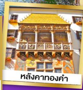
หลังคาทองคำ