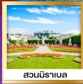
สวนมิราเบล