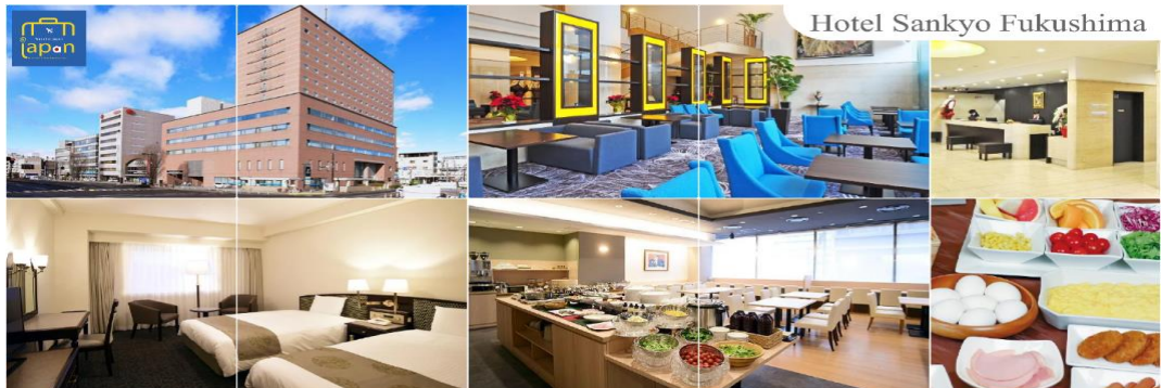
Hotel Sankyo Fukushima

HOTEL SANKYO FUKUSHIMA หรือเทียบเท่าระดับเดียวกัน