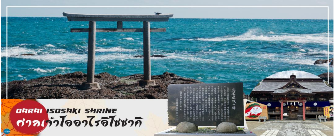
OARAI ISOSAKI SHRINE ศาลเจ้าโออาริอิโซซากิ

เดินทางสู่ ศาลเจ้าโออาริอิโซซากิ (Oarai Isosaki Shrine) ศาลเจ้าที่มีประวัติศาสตร์ยาวนาน ตั้งอยู่บนเนินเขาหันหน้าสู่มหาสมุทรแปซิฟิก เป็นหนึ่งในเสาโทริอิขนาดใหญ่ที่มีชื่อเสียงในภูมิภาคคันโต ถูกเลือกให้เป็นทรัพย์สินทางวัฒนธรรมแห่งจังหวัด และได้รับความเชื่อถือมาอย่างยาวนานใน