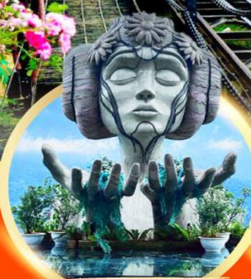
โอบาน่า ซาปา คาเฟ่