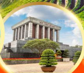
สุสานโฮจิมินห์