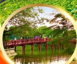
ทะเลสาบคืนดาบ