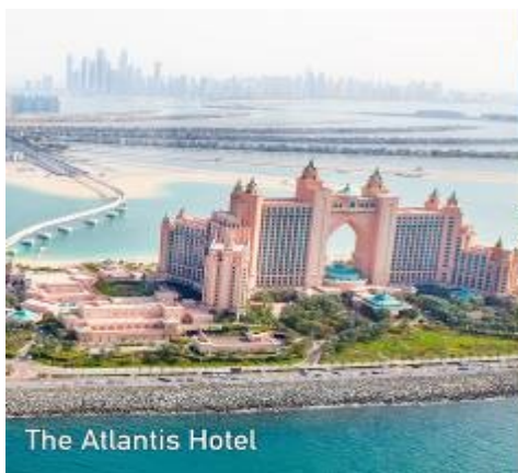
The Atlantis Hotel

นำท่าน นั่งรถไฟ MONORAIL > เดินทางสู่โครงการเดอะปาล์ม THE PALM ซึ่งเป็นโครงการที่อลังการ สุดยอดเยี่ยมโดยการถมทะเล ให้เป็นเกาะเทียมสร้างเป็นรูปต้นปาล์ม 3 เกาะ บนเกาะมีที่พักโรงแรม รีสอร์ท อพาร์ทเมนท์ ร้านค้า ภัตตาคาร รวมทั้งสำนักงาน ต่างๆนับว่าเป็นสิ่งมหัศจรรย์อันดับ 8 ของโลก