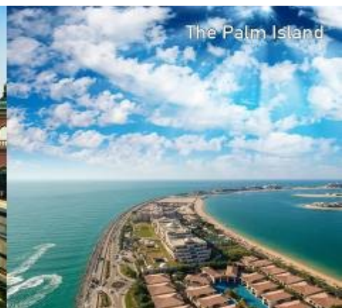
The Palm Island