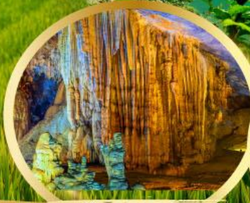
ถ้ำสวรรค์