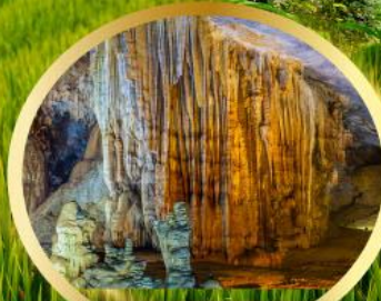
ถ้ำสวรรค์