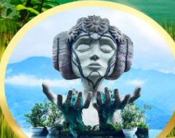
โมนาน่า ซาปา คาเฟ่