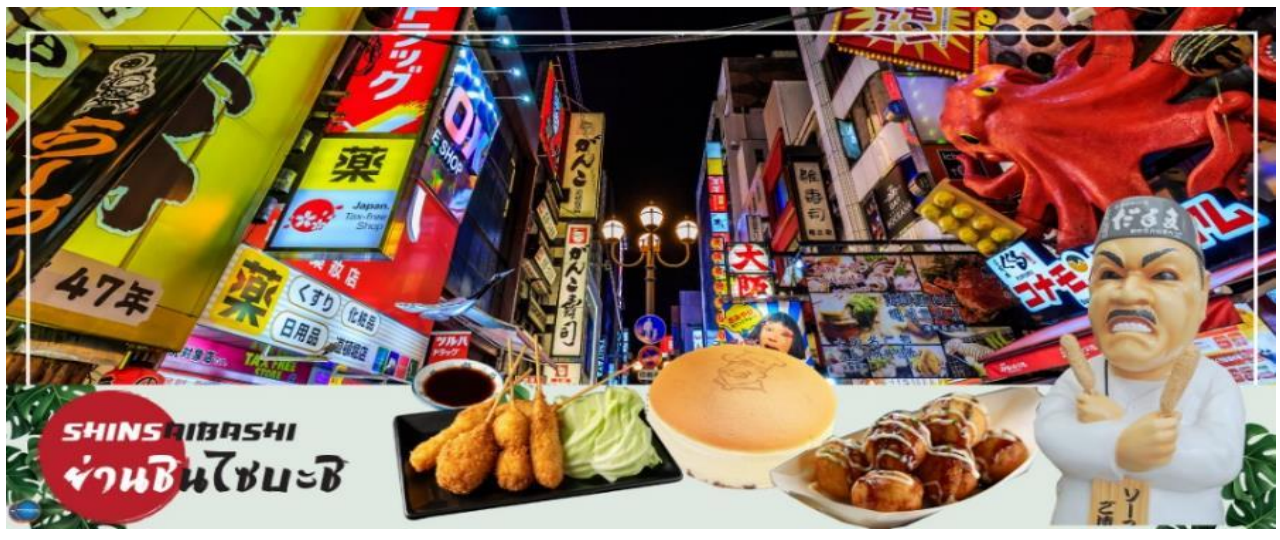
SHINSAIBASHI ย่านชินไซบาชิ

จากนั้นอีสระช้อปปิ้ง ย่านชินไซบาชิ (Shinsaibashi) บริเวณแหล่งช้อปปิ้งแห่งนี้มีความยาวประมาณ 600 เมตร เต็มไปด้วยร้านค้าปลีก ร้านแฟชั่นร้านเครื่องสำอางค์ ร้านรองเท้า กระเป๋า นาฬิกา ร้านกาแฟ ร้านอาหาร ร้านขนม ร้านเสื้อผ้าสตรีทแบรนด์ทั้งญี่ปุ่นและต่างประเทศ เช่น Zara H&M Beans ABC Mart เป็นต้น เรียกว่ามีทุกอย่างที่ต้องการรวมกันอยู่บริเวณนี้ ใกล้กันท่านสามารถเดินไปยัง ย่านโดทงโบริ (Dotonbori) ย่านบันเทิงยามค่ำคินตลอดแนวถนนเลียบบคลองโดทงโบริ จากสะพานโดทงโบริมาชิไปจนถึงสะพานนิปปอนมาชิ ไฮไลท์!!! ใครๆ ก็เชิดอิน ถ่ายภาพคู่ ป้ายกูลิโกะแมน หรือ ป้ายโดทงโบริกูลิโกะ (Dotonbori Glico Sign) เป็นป้ายไฟนีออนรูปนักกรีฑากำลังวิ่งอยู่บนลู่วิ่ง ซึ่งถูกติดตั้งมาตั้งแต่ ปี ค.ศ.1935 นอกจากนี้ยังมีอีกหนึ่งสัญลักษณ์สถานที่นัดพบกันหลง นั่นก็คือ ร้านปูคานิดอรากุ (Kani Doraku) ซึ่งมีปูยักษ์ขยับแขนและลูกตาได้อีกด้วย และห้ามพลาดสำหรับ ทาโกะยากิ อาหารท้องถิ่นของชาวโอซาก้า ที่มาถึงถิ่นแล้วต้องลอง Original Taste รับรองไม่ผิดหวังแน่นอน