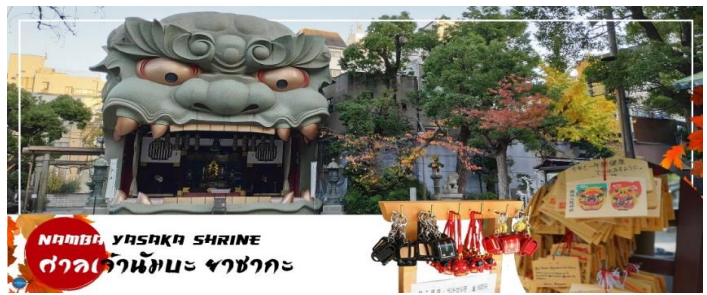
NAMBA YASAKA SHRINE ศาลเจ้านัมมะ ยะซะกะ

รูปปั้นหน้าสิงโตอัปาคขนาดใหญ่ ที่เชื่อกันว่า สามารถกลืนกินปีศาจร้าย หรือ สิ่งไม่ดีทั้งหลาย ให้หายไป และนำพามาซึ่งความโชคดีให้แก่ผู้คน ปัจจุบันนักเรียน นักศึกษา และผู้ประกอบการธุรกิจนั้น นิยมมาขอพรให้ประสบความสำเร็จกันที่นี่ ด้วยความสูง 17 เมตร ความกว้าง 11 เมตรและ ความลึก 7 เมตร อีสระให้ทุกท่านสักการะ และเก็บภาพที่ ศาลเจ้านัมมะ ยะซะกะ