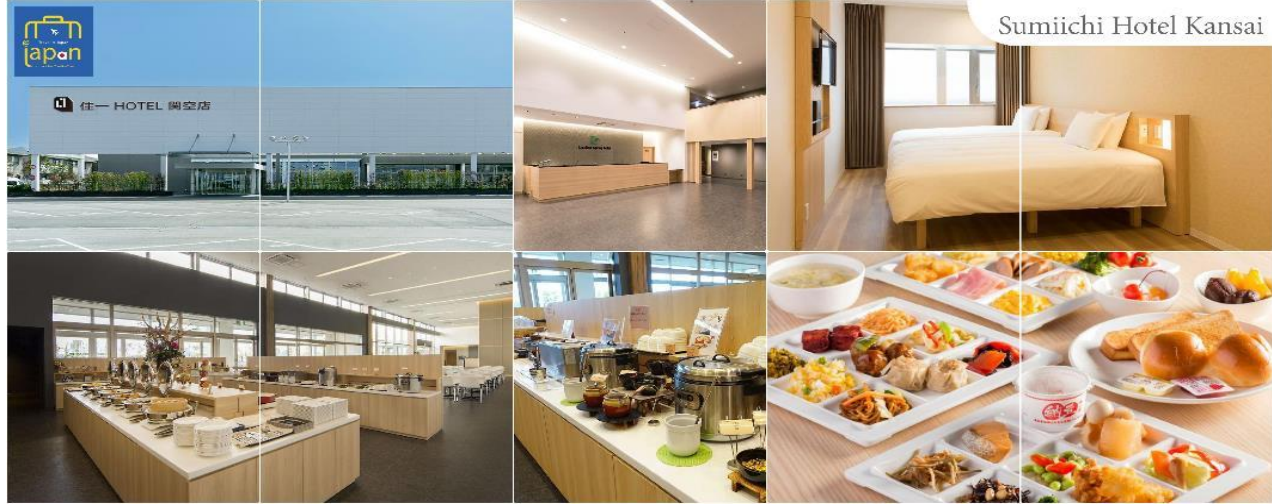
Sumiichi Hotel Kansai

พักที่ SUMIICHI HOTEL KANSAI หรือเทียบเท่าระดับเดียวกัน