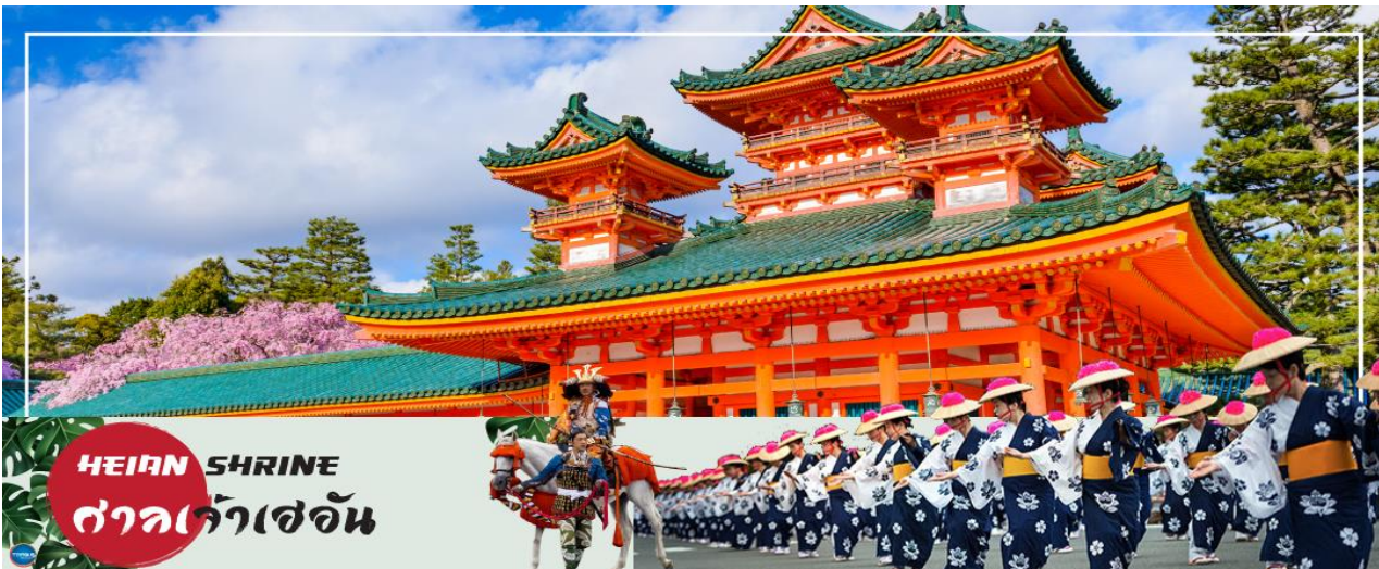
HEIAN SHRINE ศาลเจ้าเฮอัน

วันที่สาม เมืองโอซาก้า - เมืองเกียวโต - ศาลเจ้าเฮอัน - การเรียนพิธีชงชาญี่ปุ่น - ศาลเจ้าฟูชิมิอินาริ - เมืองโอซาก้า - LALAPORT & MITSUI OUTLET PARK OSAKA KADOMA