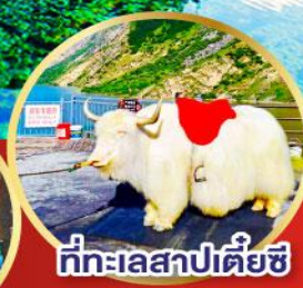
ที่ทะเลสาปเตี้ยซี