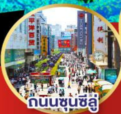
ถนนชุนชิว

-เมนูพิเศษ สุกี้หม่าล่าเสฉวน , เปิดบักกิ้ง