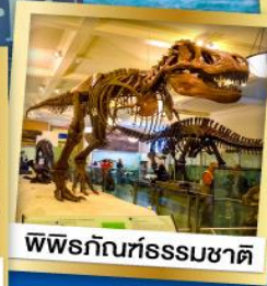
พิพิธภัณฑ์ธรรมชาติ