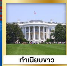
ทำเนียบขาว