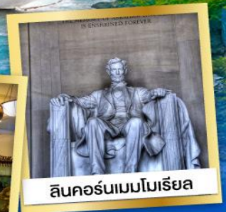
ลินคอร์นเมมโมเรียล