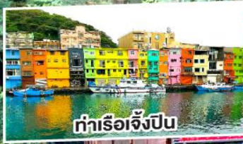
ท่าเรือเจี๋ยปิ่น