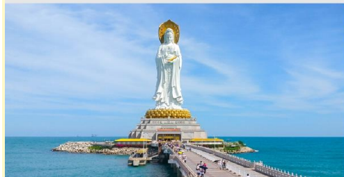
เจ้าแม่กวนอิมหนานซาน