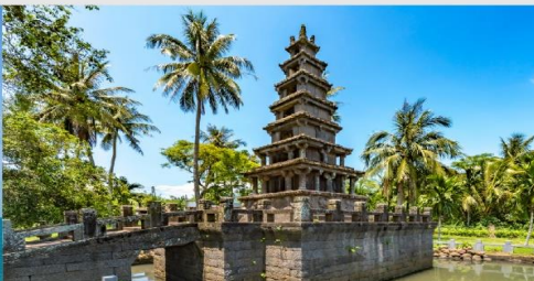
เจดีย์ 2 ชั้นเหมยหลาน