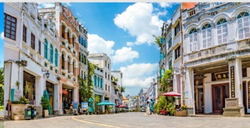
ถนนโบราณฉีโหลว

*ทางบริษัทฯ ขอสงวนสิทธิ์ในการสลับโปรแกรมทัวร์ตามความเหมาะสมขึ้นอยู่กับสถานการณ์หน้างาน โดยคำนึงถึงผลประโยชน์ของลูกค้าเป็นสำคัญ