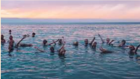
ท่านพักผ่อนตามอัธยาศัย

นำท่านเดินทางสู่ ทะเลสาบเดดซี (Dead Sea) (ใช้เวลาเดินทางประมาณ 45 นาที) หรือที่เรียกกันว่า ทะเลมรณะ อีกสมญานามหนึ่งว่าเป็น "ทะเลที่ไม่มีวันจม" ตั้งอยู่ตรงเขตแดนประเทศจอร์แดนและอิสราเอล เป็นจุดที่ต่ำที่สุดในโลก มีความต่ำกว่าระดับน้ำทะเลถึง 400 เมตร และมีความเค็มที่สุดในโลกมากกว่า 20% ของน้ำทะเลทั่วไป ทำให้ไม่มีสิ่งมีชีวิตใดเลยอาศัยอยู่ได้ในท้องทะเลแห่งนี้ ความเข้มข้นของเกลือละลายอยู่สูงทำให้คนสามารถไปลอยน้ำในเดดซีได้ นำท่านเดินทางสู่โรงแรมที่พัก โรงแรมตั้งอยู่ริมทะเลสาบเดดซี ให้ท่านได้สนุกกับการพอกโคลน เพื่อบำรุงผิวพรรณ ให้นุ่มเนียน และผลิตฟิล์มกับการลอยตัวในทะเลเดดซี เพื่อสุขภาพผิวพรรณที่ดี อิสระให้