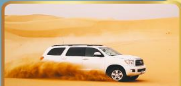
นั่งรถ 4WD ตะลุยทะเลทราย