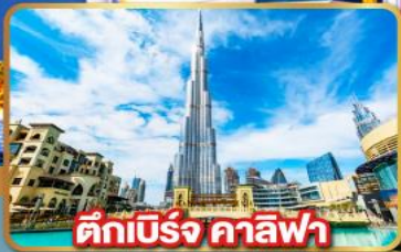
ตึกเบิร์จ คาลิฟา