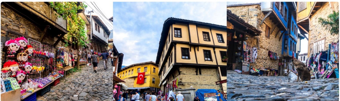
หน้า 15 (ภาพใช้เพื่อการโฆษณาเท่านั้น)

จากนั้นให้ท่านได้สัมผัสบรรยากาศใหม่ ไม่เหมือนใครกับการชมเมืองอิสตันบูล รูปแบบสไตล์เมืองเก่า นั่นคือ ย่าน FENER & BALAT ชุมชนชาวยิวเก่าแก่ กว่า 100 ปี ที่อาศัยอยู่ในเขตเมืองเก่าของกรุงอิสตันบูล โดยอยู่ฝั่งบริเวณเขตยุโรป ท่านจะได้สัมผัสความคลาสสิกของตึกเก่า ที่ปลูกสร้างตามแนวสันเขาเล่นระดับแบบมีเอกลักษณ์ และที่สำคัญยังสวยงาม ด้วยสีส้มสดใส สะดุดตา น่ามอง จนทำให้เกิดเป็นมุมถ่ายรูป ชิคๆ เก๋ๆ มากมายในเขตชุมชนแห่งนี้ และน่าแปลกใจเป็นอย่างมาก เนื่องจากความสงบเงียบ และ