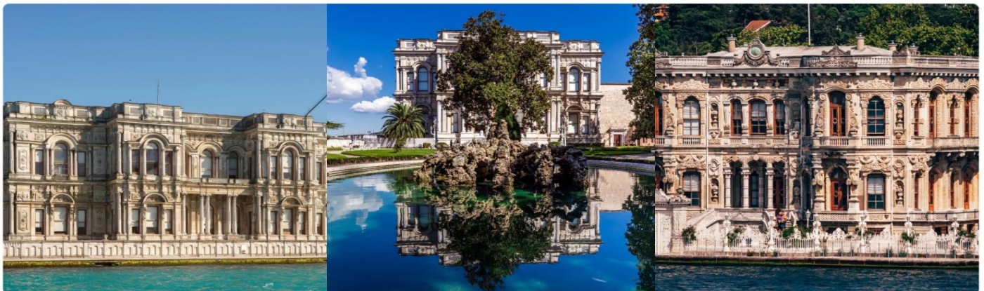
หน้า 14 (ภาพใช้เพื่อการโฆษณาเท่านั้น)

เช้า 📍 บริการอาหารเช้า ณ ห้องอาหารของโรงแรม จากนั้นนำท่านชม พระราชวังเบลเลอเบย์ (BEYLERBEYI PALACE) เป็นพระราชวังที่ตั้งอยู่ริมฝั่งทะเล ของช่องแคบบอสฟอรัสในฝั่งเอเชีย ใกล้กับสะพานข้ามช่องแคบฯ แห่งแรก ถือเป็นพระราชวังฤดูร้อน