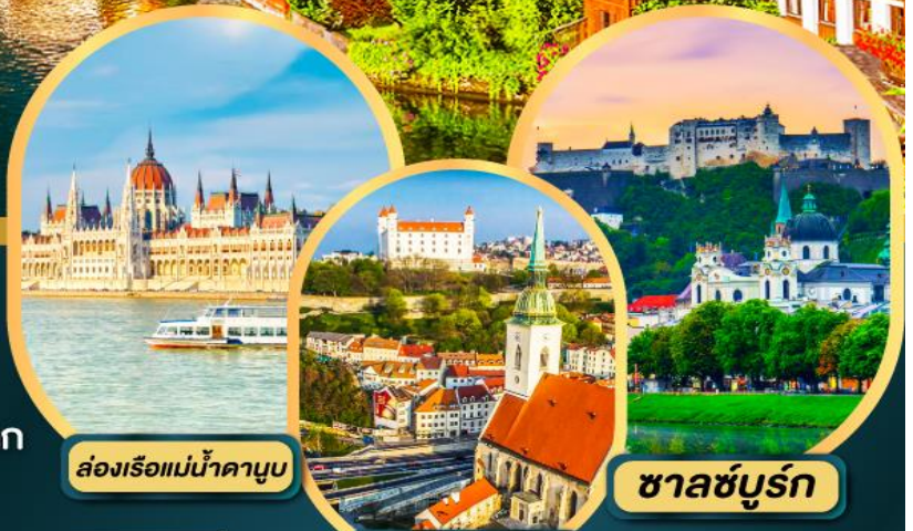
ส่องเรือแม่น้ำดานูบ