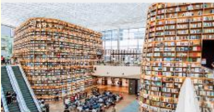
STARFIELD COEX MALL