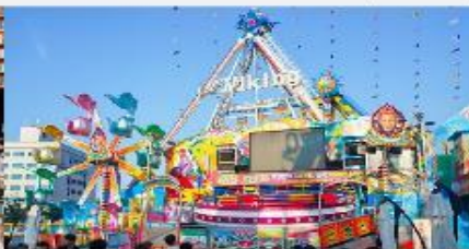
WOMIDO THEME PARK