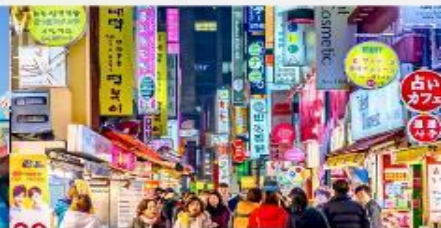
ตลาดเมียงดง

*ทางบริษัทฯ ขอสงวนสิทธิ์ในการสลับโปรแกรมทัวร์ตามความเหมาะสมขึ้นอยู่กับสถานการณ์หน้างาน โดยคำนึงถึงผลประโยชน์ของลูกค้าเป็นสำคัญ