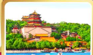
พระราชวังฤดูร้อนอ้อเหอหยวน