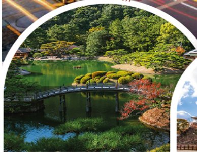
สวนริทสึริน