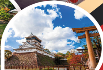
ปราสาทโคคุระ