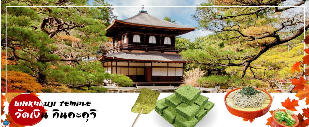
GINKAKUJI TEMPLE วัดเงิน กินคะคุจิ