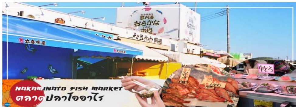
NAKAMINATO FISH MARKET ตลาดปลาโออาไร