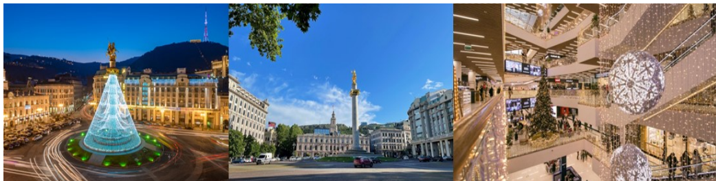
Georgia New Year 6D4N (TBS-TBS), ON 27 DEC-01 JAN AND 28 DEC- 02 JAN 2024

นำท่านชม โบสถ์ทรินิตี้ Holy Trinity Cathedral วิหารศักดิ์สิทธิ์ของทбилиซี ที่เรียกกันว่า Sameba เป็นโบสถ์หลักของคริสตจักรออร์ทอดอกซ์จอร์เจียตั้งอยู่ในทбилиซีเมืองหลวงของจอร์เจีย สร้างขึ้นระหว่างปี 1995 ถึง ปี 2004 และเป็นวิหารที่สูงที่สุด อันดับที่ 3 ของโบสถ์ออร์ทอดอกซ์ในโลก นำท่านเดินเล่นชมเมืองทбилиซีย่าน ฟรีดอมสแควร์ Freedom Square จตุรัสใจกลางเมืองที่ถูกสร้างขึ้นสมัยถูกปกครองโดยสหภาพโซเวียต เป็นศูนย์กลางของเส้นทางการคมนาคมของกรุงทбилиซีและยังเป็นที่ตั้งของอาคารรัฐสภาและหน่วยงานของรัฐ ให้ท่านได้ชมบรรยากาศของอาคารบ้านเรือนอันคลาสสิกสุดอลังการในสถาปัตยกรรมยุโรปแบบนีโอโคโลเนียลอันสุดคลาสสิก หรือช้อปปิ้งที่ห้าง Galleria Mall ศูนย์การค้าใจกลางกรุงทбилиซีที่เต็มไปด้วยร้านค้า ร้านอาหาร คาเฟ่ และสินค้าแบรนด์เนมหลากหลายแบรนด์ **เพื่อความสะดวกในการเดินเล่นชมเมืองและเลือกซื้อสินค้าอิสระรับประทานอาหารค่ำตามอัธยาศัย**