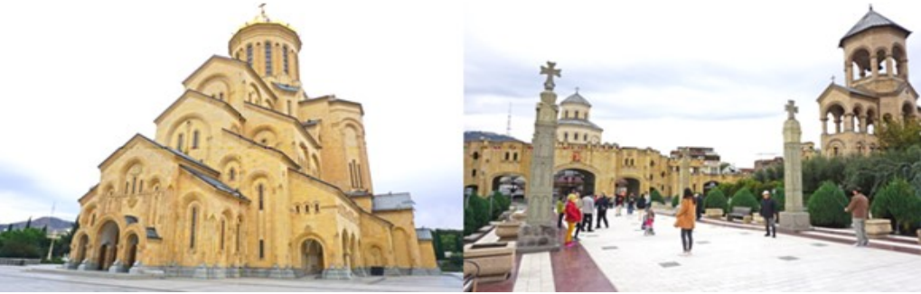
Georgia In Love 6D4N (TBS-TBS), ON OCT- NOV 2024

เช้า รับประทานอาหารเช้าที่โรงแรม นำท่าน ชมโบสถ์ทรีนิตี้ Holy Trinity Cathedral วิหารศักดิ์สิทธิ์ของทบิลิซี ที่เรียกกันว่า Sameba เป็นโบสถ์หลักของคริสตจักรออร์ทอดอกซ์จอร์เจียตั้งอยู่ในทบิลิซีเมืองหลวงของจอร์เจีย สร้างขึ้นระหว่างปี 1995 ถึง ปี 2004 และเป็นวิหารที่สูงที่สุด อันดับที่ 3 ของโบสถ์ออร์ทอดอกซ์ในโลก นำท่านเที่ยวชมย่านเมืองเก่าของกรุงทบิลิซี Old Town of Tbilisi ซึ่งท่านจะได้พบเห็นความสวยงามและสีสันของอาคารบ้านเรือนที่เป็นสถาปัตยกรรมอันโดดเด่นโดยผสมผสานกันระหว่างศิลปะของเปอร์เซียและยุโรป ทำให้จอร์เจียมีเอกลักษณ์และสัญลักษณ์ของตะวันตกและตะวันออกในประเทศเดียว