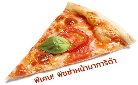
พิเศษ! พิซซ่าหน้ามาการิตต้า

นำท่านเดินทางสู่ เมืองโคโม (Como) (ระยะทาง 51 กม. / 45 นาที) ตั้งอยู่บริเวณพรมแดนกับประเทศสวิตเซอร์แลนด์ โคโมเป็นเมืองที่ตั้งอยู่ในเทือกเขาแอลป์ พาทุกท่านไปเก็บภาพความประทับใจกับ ทะเลสาบโคโม (Lake Como) ขึ้นชื่อว่าเป็นทะเลสาบที่สวยงามที่สุดในโลก มีรูปร่างลักษณะเฉพาะของทะเลสาบโคโมทำให้นึกถึง Y ที่กลับด้านที่โด่งดังไปทั่วโลก เป็นผลมาจากการละลายของธารน้ำแข็งรวมกับการกัดเซาะของแม่น้ำ Adda โบราณ ทำให้เกิดทางแยกเป็นตัว Y และยังเป็นทะเลสาบมีทิวทัศน์ที่งดงามที่สุดแห่งหนึ่งในโลก