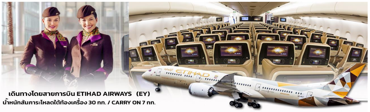
เดินทางโดยสารการบิน ETIHAD AIRWAYS (EY) น้ำหนักสัมภาระโหลดใต้ท้องเครื่อง 30 กก. / CARRY ON 7 กก.

** การันตี 15 ท่านออกเดินทาง พร้อมหัวหน้าทัวร์คนไทย **