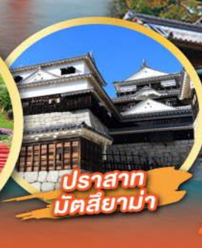
ปราสาท มัตสึยาม่า