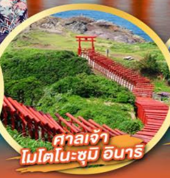
ศาลเจ้า โมโตโมะซุมิ อินาริ