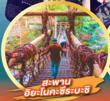
สะพาน ฮิยะโนะคะชิระบะชิ