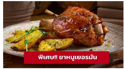
พิเศษ! ขาหมูเยอรมัน

เที่ยง ๑๐ รับประทานอาหารกลางวัน (มื้อที่6) เมนูพิเศษ! ขาหมูเยอรมัน นำท่านเที่ยวชม เมืองฟูสเซน (Fussen) ขึ้นชื่อเรื่องความสวยงามของตัวตึกรามบ้านช่องเพราะทั้งเมืองจะมีหลากสีส้มเหมือนกับลูกกวาดสีสวยๆ ทั้งเมืองจนได้รับสมญานามว่า City of candy นำท่านเดินทางสู่ เมืองเคมป์เทิน (Kempten) (ระยะทาง 46 กม./ 1 ชั่วโมง) เป็นชุมชนเมืองที่เก่าแก่ที่สุดในเยอรมนี ให้ท่านถ่ายรูปบริเวณ ด้านนอก มหาวิหารเซนต์ลอว์เรนซ์ แอชวิลล์ (Basilica of Saint Lawrence) สร้างเสร็จในปี 1909 และเป็นหนึ่งในสมบัติทางสถาปัตยกรรมและจุดยึดทางจิตวิญญาณของแอชวิลล์