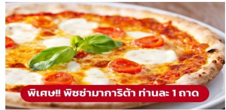
พิเศษ!! พิซซ่ามาการิต้า ท่านละ 1 ถาด

นำท่านเดินทางสู่ เมืองเวนิสเมสเตร (Venice Mestre) (ระยะทาง 322 ก.ม. / 5 ชม.) หนึ่งในเมืองเวนิส เป็นย่านเมืองเก่าแก่ ที่มีความสวยงามและน่าสนใจเป็นอย่างมาก ที่จะแสดงให้เห็นถึงความ เป็น อิตาเลียนขนานแท้