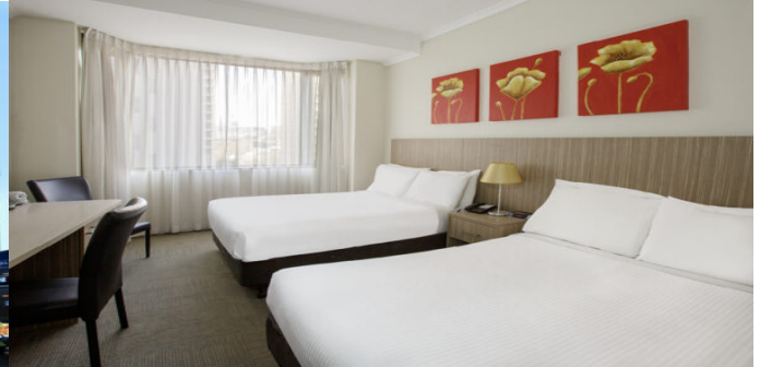
(โรงแรมย่านกลางเมือง ใกล้แหล่งช้อปปิ้ง เดินทางสะดวก) *รูปภาพเพื่อการโฆษณา*

วันที่สอง (วันที่ 28 ธ.ค.67) นครซิดนีย์ – อุทยานแห่งชาติบลูเมาท์เทนส์ – สวนสัตว์พื้นเมือง FEATHERDALE