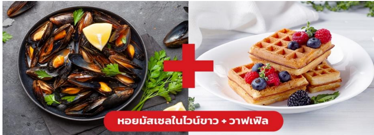
หอยมัสเซลในไวน์ขาว + วาฟเฟิล

🍴 รับประทานอาหารกลางวัน (มือที่10) เมนูพิเศษ!! หอยมัสเซล + วาฟเฟิล (Mussel in White wine + Waffle)