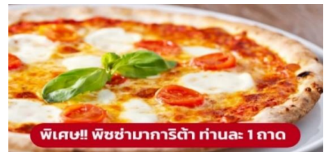
พิเศษ!! พิซซ่ามาการิตต้า ท่านละ 1 ถาด

นำท่านเก็บภาพความประทับใจและถ่ายรูป 1 ใน 7 สิ่งมหัศจรรย์ของโลก หอเอนปิซ่า (Leaning Tower of Pisa) หอเอนปิซ่าที่สร้างขึ้นเพื่อเป็นหอรชงแห่งวิหารประจำเมือง แต่เพียงการเริ่มต้นของการสร้างถึงบริเวณชั้น 3 ก็เกิดการทรุดตัวและต้องหยุดการก่อสร้างจนถัดมาอีก 100 ปี ถึงได้สร้างต่อจนเสร็จสมบูรณ์ มหาวิหารปิซ่า (Cathedral of Pisa) มหาวิหารที่สวยงามที่สุดในลักษณะโรมันเนสก์ แสดงให้เห็นจากชายหอคีลุ่ม กลางตัวมหาวิหาร และชาวหอรชง ตัวมหาวิหารเป็นผังกางเขน มีมุขท้ายวัดและตกแต่งซุ้มโค้งรอบวัดภายนอกเป็นแบบแถบหินอ่อน สลับสีทางขวาง ซึ่งกลายมาเป็นแบบที่เรียกว่า "ลักษณะปิซ่า" และโดมรูปไข่และ Pisa Baptisty of St. John เป็นอาคารทางศาสนาคริสต์นิกายโรมันคาทอลิก จากนั้นนำท่านเดินทางสู่ เมืองมิลาน (Milan) (ระยะทาง 282 กม. / 4 ชั่วโมง)