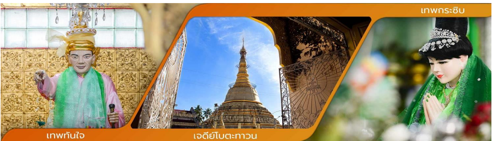
เทพทันใจ

คำบูชาเทพทันใจ เอหิ สักกะ มหานัทโปะปะจีโปตะถ่องสิทธิมัตถุ อิทังพะลัง เอตัสสะมิงรัตตะนัง พุทธัง อัมมัง สังฆัง เทวานัง ประสิทธิลาโภ ชโยนิจัจจัน วันทามิสัพพะทา สวาโหม