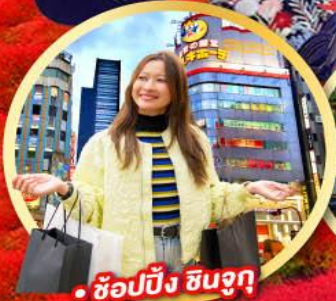
• ช้อปปิ้ง ชิบูจูกุ

• กิจกรรมใส่ชุดกิโมโน พร้อมชมโชว์การแสดงต่างๆ