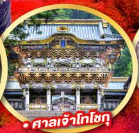
• ศาลเจ้าโทโชกุ