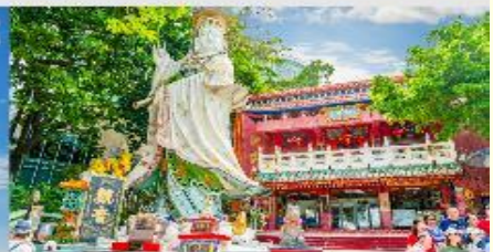
ริฟลิสเบย์

*ทางบริษัทฯ ขอสงวนสิทธิ์ในโปรแกรมทัวร์ตามความเหมาะสมขึ้นอยู่กับสถานการณ์ปัจจุบัน โดยคำปึ่งถึงผลประโยชน์ของลูกค้าเป็นสำคัญ