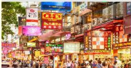
ย่านจิมซาจุ่ย