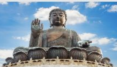
วัดใหญ่โป่วหลิน