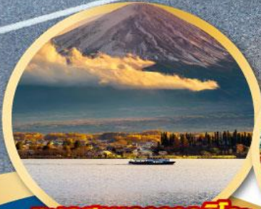
ทะเลสาบคาวากุจิโกะ