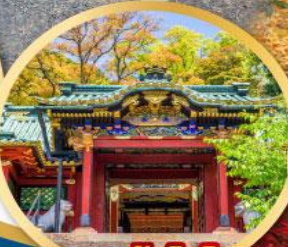
ศาลเจ้าโทโชคุ