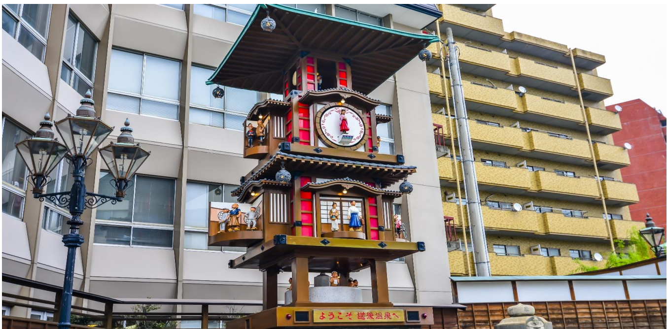
GO2KIX-TG006 -- UNSEEN SHIKOKU ONSEN AUTUMN 6D 4N BY TG

เดินทางสู่ ถนนโดโงะ ไชคาระ มีของฝากท้องถิ่นให้เลือกซื้อมากมาย ซึ่งยาว 250 เมตร และเป็นที่ตั้งของร้านอาหารและร้านค้ากว่า 60 แห่ง มีร้านจำนวนมากที่เปิดให้บริการจนถึง 22:00 น. เป็นแหล่งซื้อของที่เต็มไปด้วยเมนูอาหารที่หลากหลาย เหมาะสำหรับท่านที่เป็นนักชิม ท่านสามารถลิ้มลองเมนู เช่น บอดซัน ดังโงะ (เกี้ยวหวาน) เค้กทาร์ตอันมีชื่อของเอฮิเมะ และปลาสับทอดสูตรดั้งเดิมของเอฮิเมะและยังเหมาะสำหรับการหาซื้อของฝาก ซึ่งมีให้เลือกมากมายไม่ว่าจะเป็นเครื่องเคลือบ Tobe ware แบบดั้งเดิม ผ้าเช็ดตัวอิมาบาริอันอ่อนนุ่ม และส้มแมนดารินเอฮิเมะ ที่เป็นสัญลักษณ์ของจังหวัดเอฮิเมะ