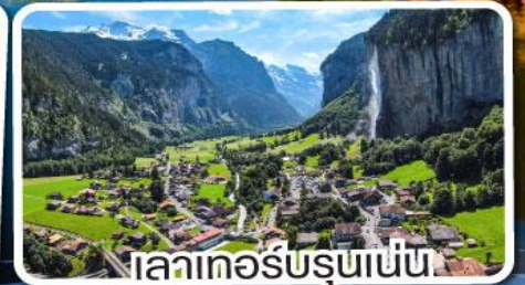
ทะเลเอ็ลเบรึน

เดินทาง 12-18 มี.ค. 68 28 มี.ค.-03 เม.ย. 68 10-16 เม.ย. 68 29 เม.ย.-05 พ.ค. 68