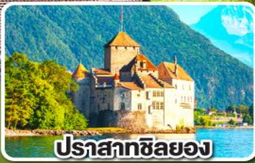
ปราสาทชิลยอง