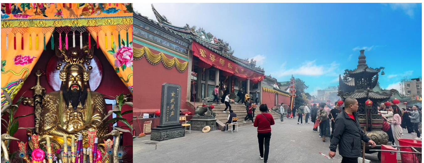
GO1SWA-CZ001 ชัวเถา หย่งตั้ง เหมยโจว แต่จิว 5วัน 4คืน โดยสายการบิน China Southern (CZ)

กลางวัน รับประทานอาหารกลางวัน ณ ภัตตาคาร (มื้อที่ 9)