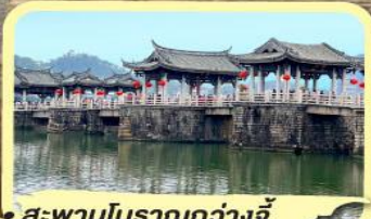
• สะพานโบราณกว้างจี