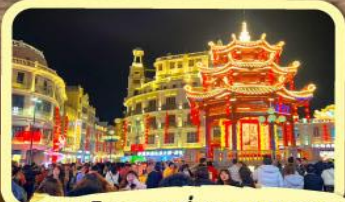
• ถนนโบราณเสียวกงหยวน