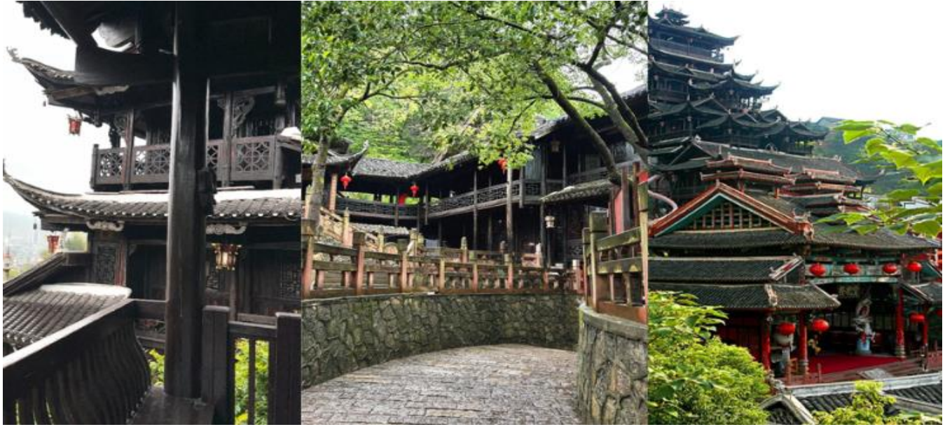
กลางวัน รับประทานอาหารกลางวัน ณ ภัตตาคาร (มื้อที่ 3)