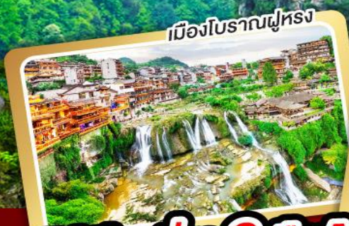
เมืองโบราณฝูหรง