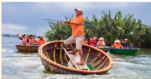
เรือกระดง